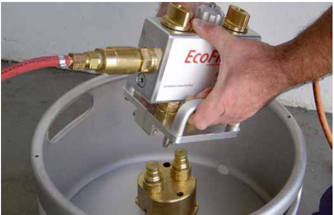
Ventilblock im Brenngasschlauch zum Anschliessen an das Flussmittelgemisch