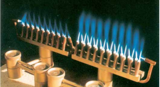
LINDOFLAMM® Sonderbrenner: Acetylen-Druckluft-Brenner

Für die Wärmezuführung zum Flammlöten eignen sich sowohl handelsübliche Schweißbrenner als auch Mehrflammen-Wärmebrenner. Einstelldrücke und Gasverbräuche sind in der für den Brennertyp gültigen Betriebsanleitung enthalten. In Form und Leistung angepasste Sonderbrenner (siehe auch Linde-Prospekt LINDOFLAMM®) sind häufig zum automatisierten Flammlöten vorteilhaft.