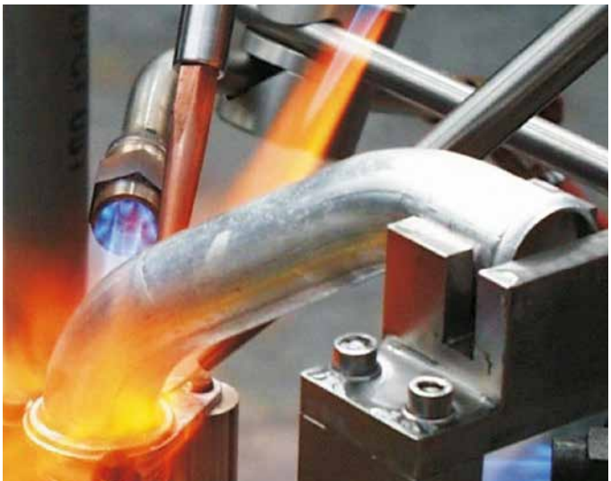
Mechanisertes Spalllöten mit automatischer Lotzufuhr

Beim Spalllöten werden die Werkstücke so vorbereitet, dass zwischen den zu lötenden Bauteilen ein enger Kapillarspalt vorhanden ist. Der Spalt wird nach Erreichen der Arbeitstemperatur hauptsächlich durch den kapillaren Fülldruck des Lotes gefüllt. Diese Verfahrensvariante wird sowohl zum Handlöten, zum teilmechanisierten Löten als auch zum vollautomatischen Löten eingesetzt.